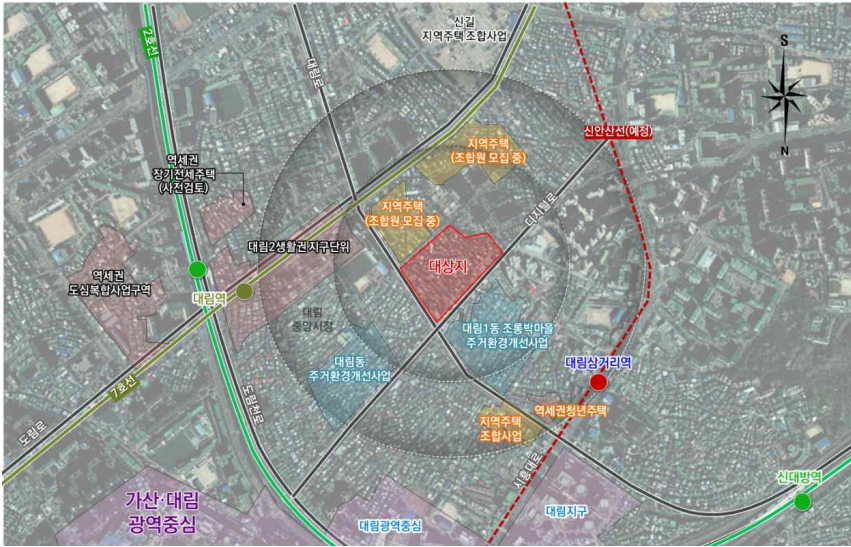
< 위치도 >