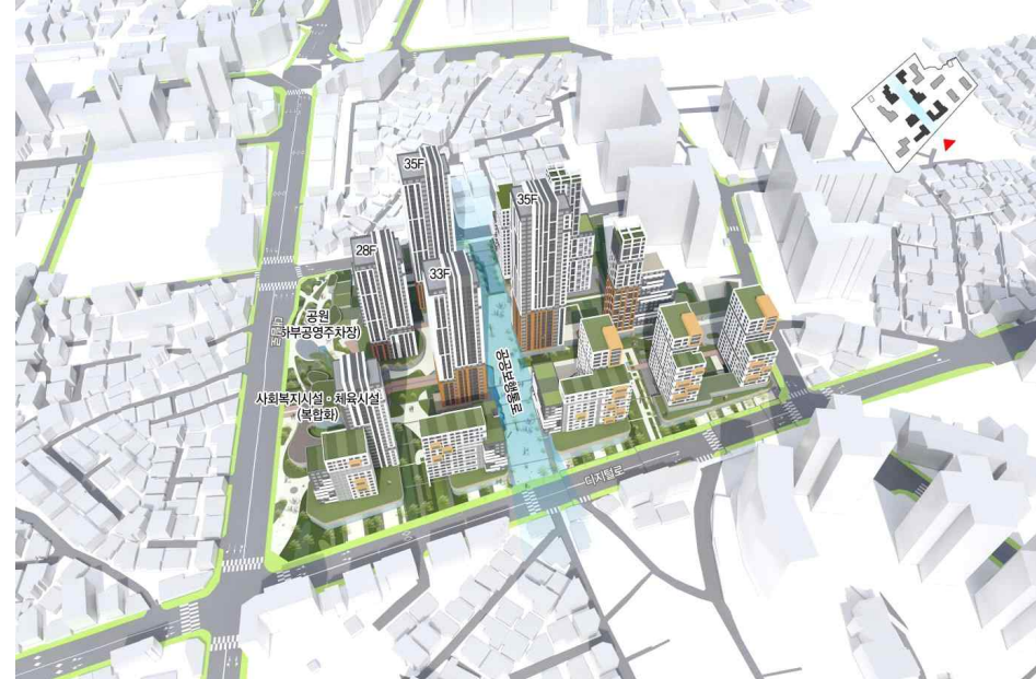
<단지배치 계획안②> 대상지 남북측 주거지 및 등굣길과 연계되는 공공보행통로 조성