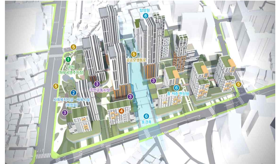
<종합구상도> 도시에 순응하며 걷고, 보고 이웃과 어우러져 즐거움이 있는 열린 단지